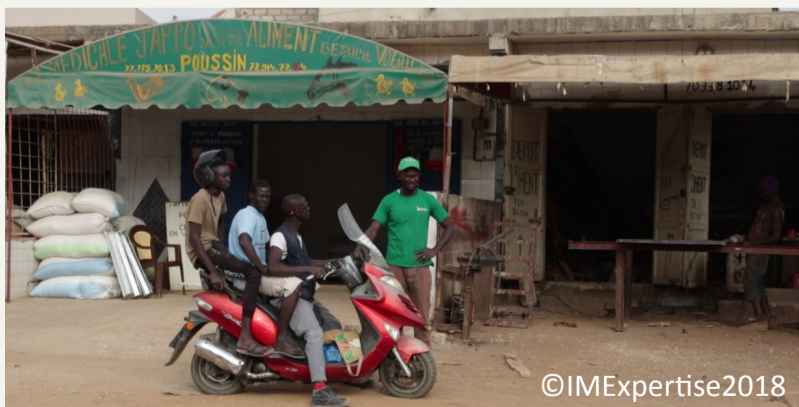
Figure 4 : commerçant revendeur d'aliment et de matériel avicole

Nombre d'employés dans la filière avicole