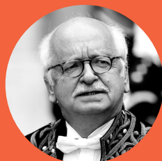
Erik Orsenna , de l'Académie française VICE-PRÉSIDENT Conseiller d'Etat