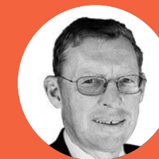
Carlo Trojan Ex-président de l'International Food and Agricultural Trade Policy Council (IPC)