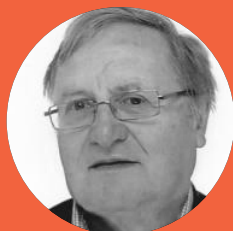
Pierre-Henri Texier TRÉSORIER Conseil général de l'alimentation, de l'agriculture et des espaces ruraux (CGAAER)