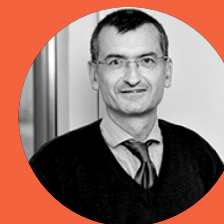
Hervé Lejeune Inspecteur général au ministère de l'Agriculture, de l'Agroalimentaire et de la Forêt (MAAF)