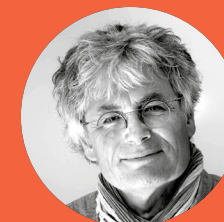
Michel Eddi Président du Centre de coopération internationale en recherche agronomique pour le développement (Cirad)