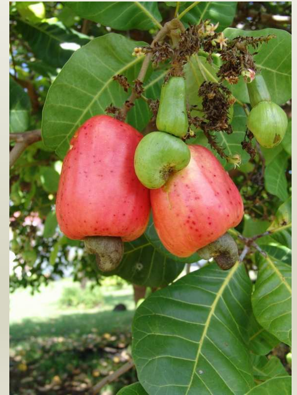
Noix de cajou